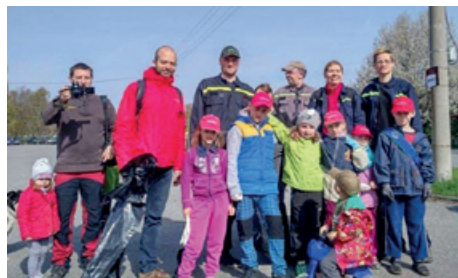
Čisté Beskydy 2016 – účastníci

Všichni jsme na památku dostali náramek s mottem Chceme čisté Beskydy, který nám připomíná, jak je důležité starat se o přírodu.