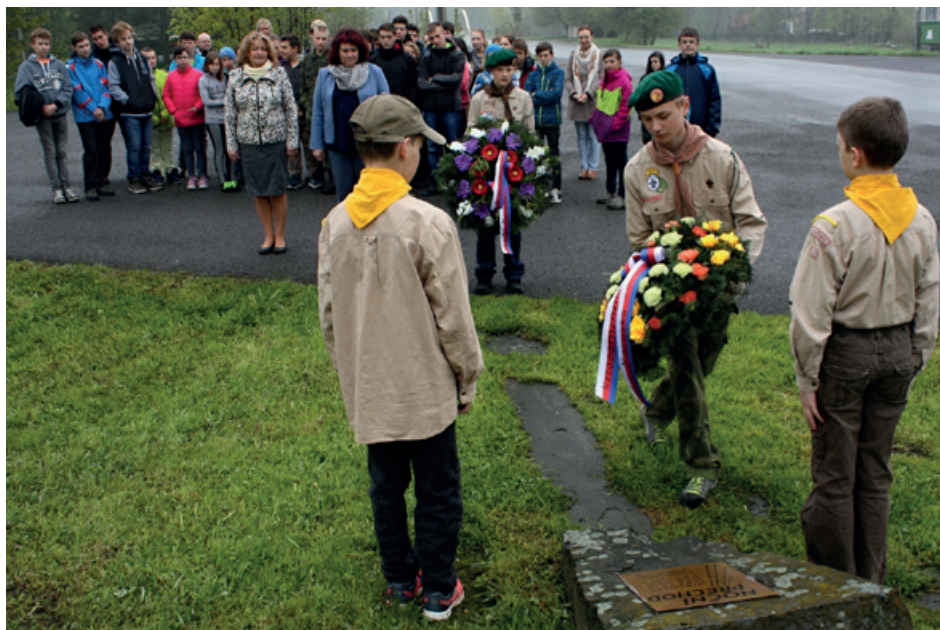
Piетní akce Den osvobození Morávky 5. května 1945 si tradičně připomenuli žáci a učitelé ZŠ spolu s představiteli obce.