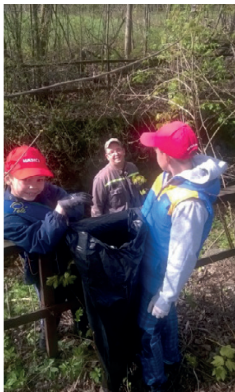
Čisté Beskydy 2016 – průběh