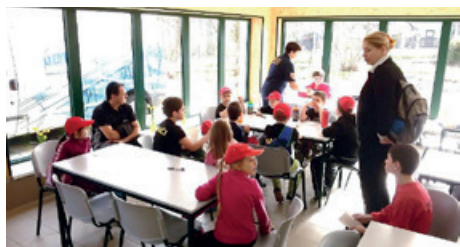
Zkoušky k získání odznaku odbornosti – Raškovice 3.4.2016

3. 4. 2016 se naši mladší žáci, starší žáci i dorostenci zúčastnili zkoušek pro plnění odznaku odbornosti. Všichni svou zkoušku zvládli a mohou si do průkazu nalepit odznáček preventivisty juniora, strojníka, kronikáře či velitele.