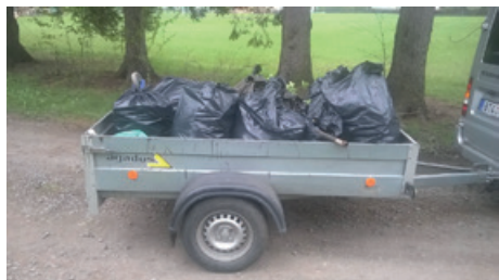
Odpad sesbíraný členy SDH Morávka při akci Čisté Beskydy 2016

25. 4. 2016 se konal druhý ročník akce Čisté Beskydy, kde jsme nemohli chybět. Účast mohla být lepší, ale i tak jsme patřili k nejpočetnější skupině na Morávce. Naplnili jsme spoustu pytlů odpadem nalezeným hlavně kolem řeky a v přilehlém okolí.