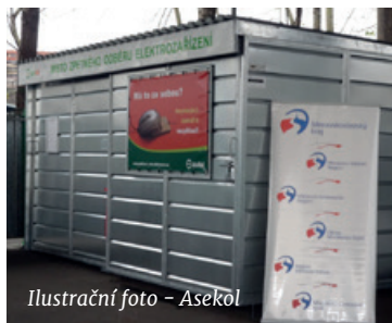
Ilustrační foto – Asekol

V lednu 2016 jsme se přihlásili do grantového řízení Fondu Asekol s projektem „Rozšíření skladovacích prostor pro vysloužilá elektrozařízení“. Dne 11.5.2016 rada Fondu Asekol náš projekt schválila. Fond Asekol nám bezplatně zapůjčí E-domek pro uskladnění vyřazených televizorů a počítačových monitorů.