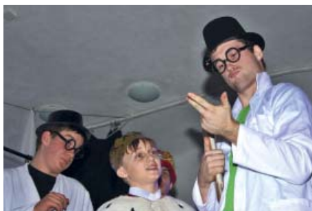
TŘI VETERÁNI