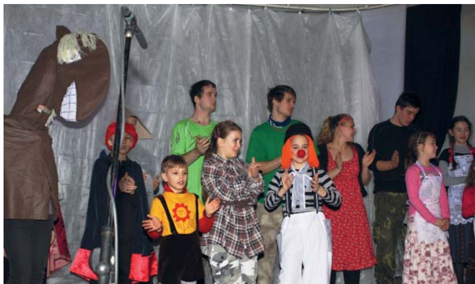
TŘI VETERÁNI