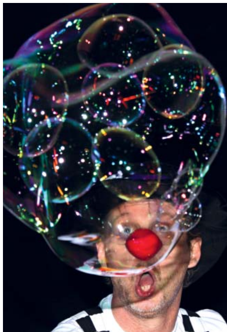
BUBLINÁDA KLAUNA BUBLÍNA

našich dobrovolných hasičů ve venkovních prostorách skupina KELTIK svou točenou ohňovou show.