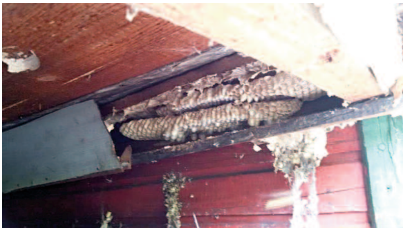
Hnízdo sršně obecné — pohled vchodu do chaty

Mimo tuto činnost jsme také poskytovali pomoc obecnímu úřadu (čištění chodníků, obřezávání větví překážejících zimnímu úklidu komunikací) a placené služby pro občany (čištění studní a doprava užitkové vody) použitím techniky nám svěřené. Celkem 9 krát.