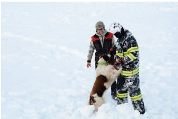
Ukázka sdružení záchranné kynologie v rámci Festivalu sněhu

Mimo povinné body programu pokračujeme v novější tradici, a to přijímáním nových členů mladých hasičů do našich řad. Další již tradiční akcí, které se naši členové účastní a pomáhají tak obci Morávka, je Festival sněhu, kde asistujeme při pořádání jeho vrcholného dne. Letos to bylo také figurování při ukázce vyhledávání — Sdružení záchranné kynologie. Pořádání plesů patřilo také již historicky k jedné z kulturních činností sboru. Po několikaleté přestávce byl loni uspořádán první ples v hotelu Morávka a letos došlo k návratu do hotelu Partyzán (21. 2. 2015). Další větší akcí bylo uspořádání soutěže v požárním útoku družstev v kategoriích mladých hasičů, mužů a žen nazvané po dlouholetém veliteli sboru — Memoriál Josefa Špoka. Větší část členů našeho sboru jste také mohli vidět při oslavách 400 let založení obce Morávka, kde pomáhali s organizací a naši nejmladší zde měli povedenou ukázkou s překvapením. Členové sboru také pomáhali při údržbě areálu při dolní stanici vleku na sjezdovce Sviňorky.