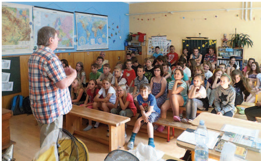
Beseda p. Uherka s dětmi ve škole