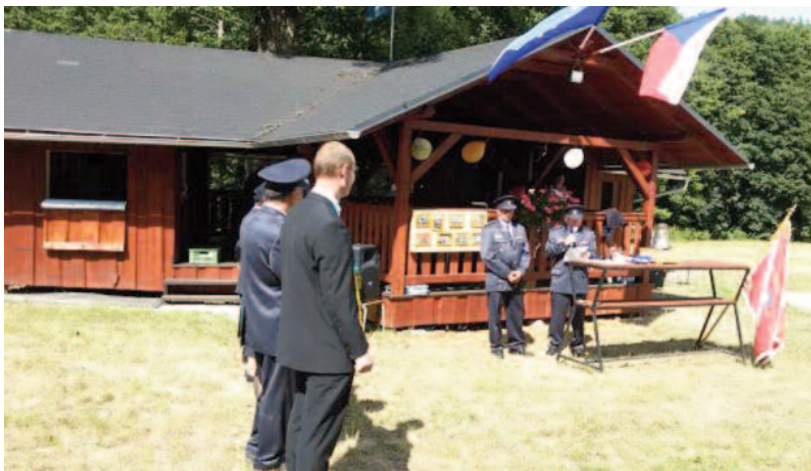
Oslava 70 let založení Sboru dobrovolných hasičů Vraclávek

Pokračovat budu v přiblížení činností výjezdového družstva Morávka, jednotky Sboru dobrovolných hasičů Pražmo — Morávka. Jelikož jsou její členové i členy sboru, tak se samozřejmě účastnili všech akcí popsaných výše, za což jim patří velký dík. Další dík jim patří také za výjezdovou činnost, údržbu techniky a zázemí a další pomoc občanům obce. Těchto členů je celkem 15 a letos jsme zasahovali u těchto událostí: