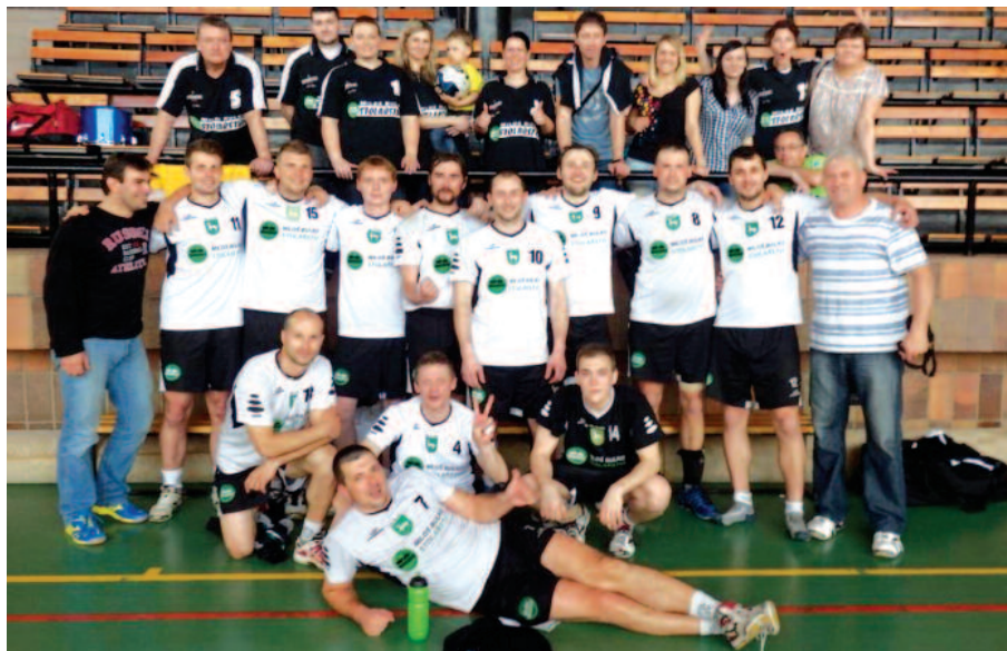
Volejbalisté LIGNUM Morávka