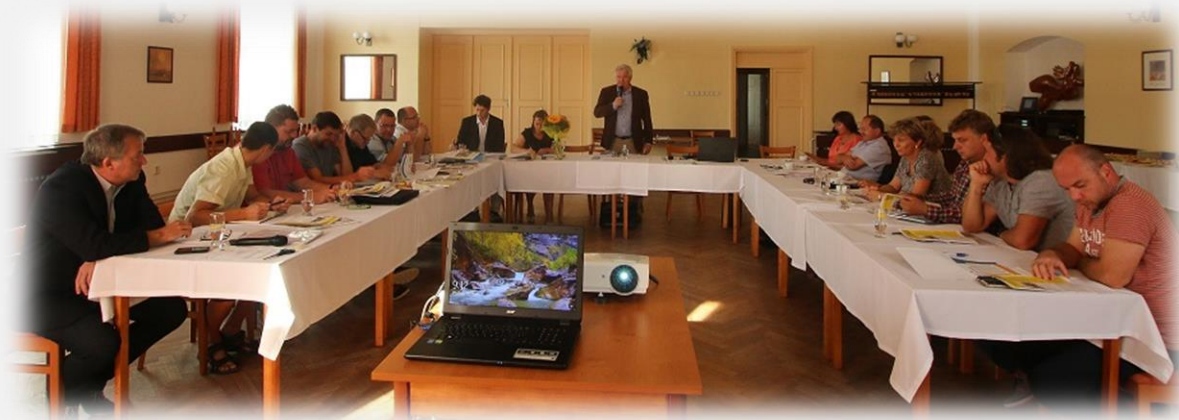
Jednání CSS se starosty obcí Regionu Slezská brána 15. září 2016.

CSS je v přípravné fázi a chystá se na období realizace prvních větších projektů. Aktuálně například zorganizovalo první setkání starostů DSO Region Slezská brána a převzalo kompetence dosavadního tajemníka RSB, schválilo Strategický plán DSO Region Slezská brána na období 2016-2020 a projednalo společný nákup energií pro obce v RSB. CSS spolupracuje s dobrovolným svazkem obcí na přípravě Dne regionů (24. září) a projednalo přeshraniční spolupráci DSO s polským partnerem (Paskov-Pszczyna). Naše pracoviště denně komunikuje se starosty obcí a sbírá podněty pro projekty, které pak budou realizovány v území RSB.